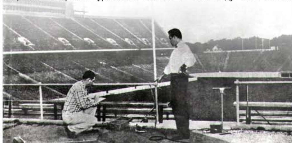
На климатической станции в Звенигороде

После ВОВ появилась новая задача государственного масштаба – создание атомной бомбы. Встал вопрос о коррозионном обеспечении технологии производства урана. Естественно, что Георгий Владимирович как ведущий специалист в СССР по вопросам коррозии был привлечен к решению этой проблемы. Совместно с Р.С. Амбарцумяном он возглавил комиссию по вопросам защиты от коррозии при создании первого промышленного уран-графитового реактора. За изучение коррозии металлов реактора и разработку защитного покрытия урановых блоков в 1949 году Г.В. Акимов