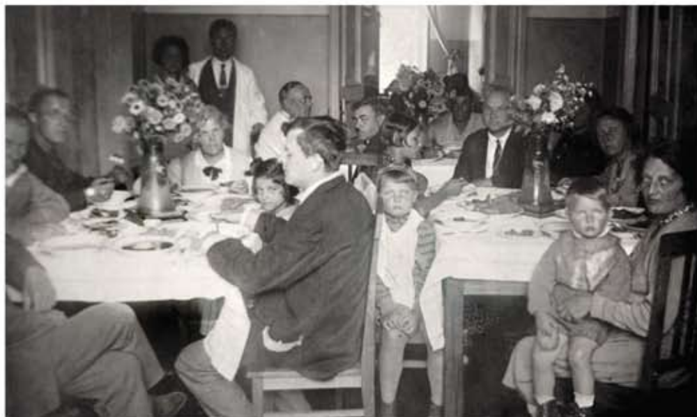
На отдыхе в Кисловодске (1934 г.)

был награжден орденом Трудового Красного Знамени и удостоен звания лауреата Сталинской премии второй степени.